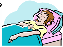
びょうき 病気です

ケガや痛 いた いところはどこですか？ 伝え つた たいこと、何 なん でも書 か いてください。