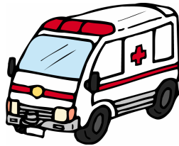
きゅうきゅうしゃ 救急車