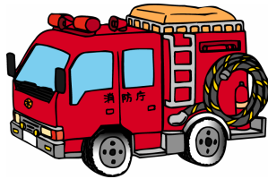
しょうぼうしゃ 消防車