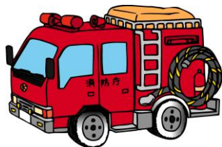
しょうぼうしゃ 消防車