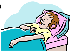
びょうき 病気です

ケガや痛 いた いところはどこですか？ 伝 つた えたいこと、何 なん でも書 か いてください。